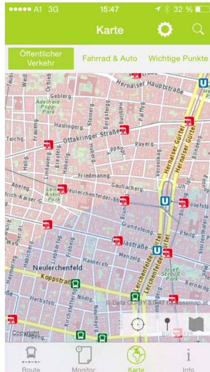
Abbildung 4: Karte