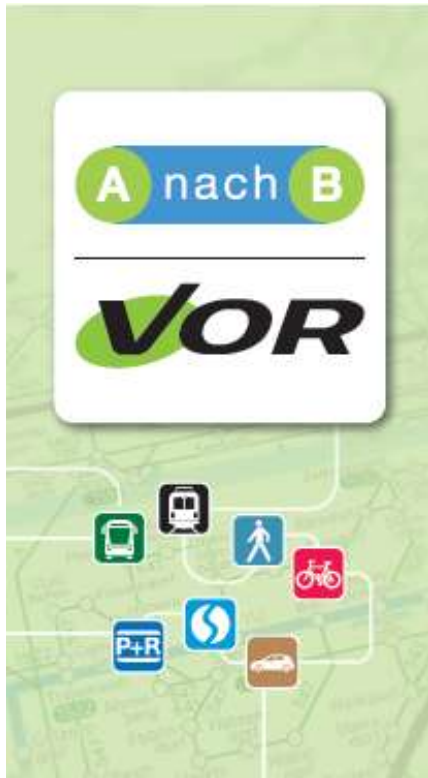
Abbildung 1: AnachB | VOR App