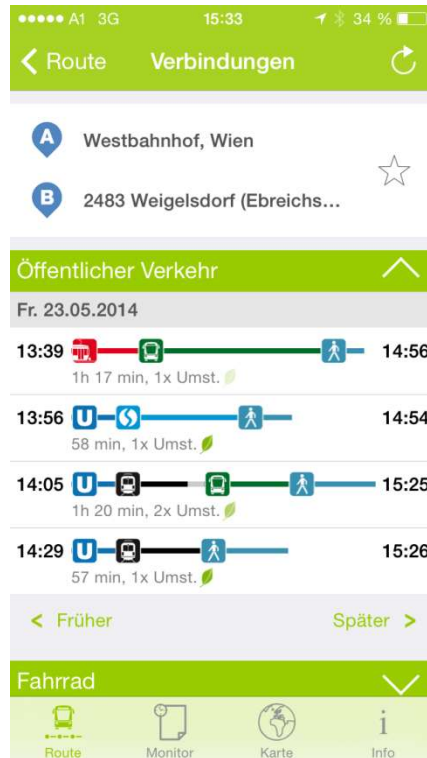
Abbildung 2: Route